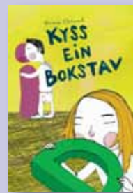
· Kys ein bokstav · Av: Erna Osland · Skald 2011

Ord og kjensler høyrer saman. Ofte kan det vere godt å setje ord på noko som er vanskeleg, litt rart eller berre dumt. Og somme tider kan orda vere sjølve døropnaren. Vesle Dunja har nett lært seg å lese, og no lærer ho farfar å lese. Farfaren har