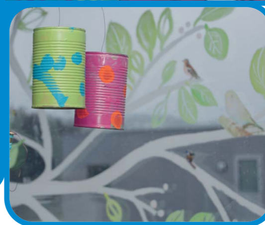
Vindauga vert dekorerte etter årstidene

Kjekk kar, kommer og går med fyrstikklegger og korkelår, med håndtak i ryggen og rutete hår.