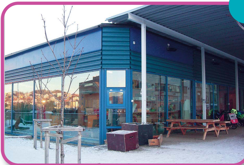
Barnehagen har tatt vare på den originale fasaden.

Den gamle fasaden er bevart, store utstillingsvindu gir ei mengd lys inn i dei vakre lokala. Inne