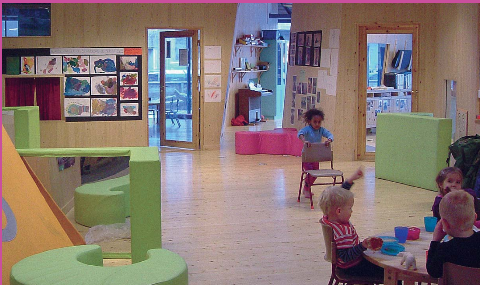
Lyse og luftige lokale utforma av arkitektane Olav Kristoffersen og Geir Brendeland.