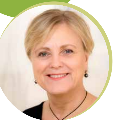
Kulturminister Thorhild Widvey (H)

Me ynskjer eit tett samarbeid med profesjonelle kunstnarar om dette. Eit flott døme er Den Norske Opera og Ballett sitt samarbeid med fire osloskular om ei framsyning for femteklassingar. Tenk for ei oppleving det er for borna å få setje opp ein opera! Det er viktig at born og unge får høve til å delta sjølve, både dei som seinare vil bli profesjonelle kunstnarar, og dei som vil ha kunst og kultur som ein kjær hobby. Kunst og kultur er til glede og nytte heile livet. Ikkje minst for dei aller yngste.