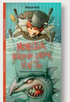
Av: Wenche With Illustrert av Jens Kristensen Mangschou 2014